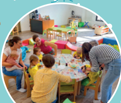
De nouveaux locaux pour l'Association Espace Enfants