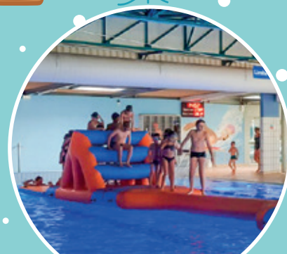
Venez vous amuser à l'Aquaried !