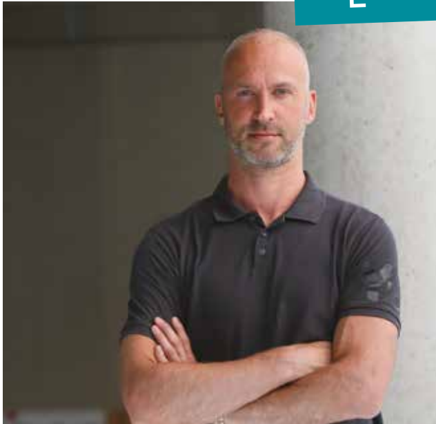
Thierry Omeyer, champion olympique & champion du monde de handball.